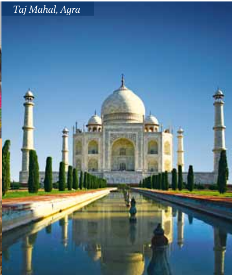
Taj Mahal, Agra