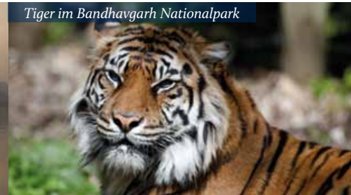
Tiger im Bandhavgarh Nationalpark