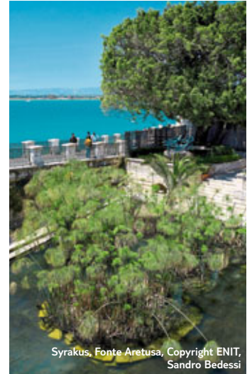
Syrakus, Fonte Aretusa

Bei dieser Rundreise der Reisewelt TUI CLASSIC erwartet Sie: