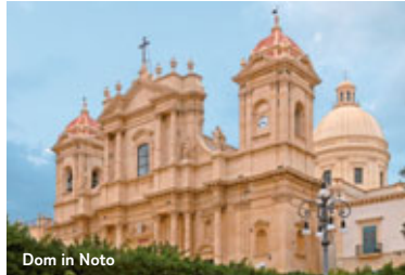
Dom in Noto