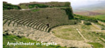
Amphitheater in Segesta